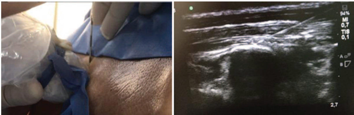
Figura 1. Punción en plano a nivel de T6-T7.

previo consentimiento informado, y mediante ultrasonido se hizo el bloqueo ESP siguiendo la técnica descrita por Forero y colaboradores, 9 punción única con aguja Tuohy N° 18 en hemitórax izquierdo a nivel T6-T7; se administraron: Bupivacaína con epinefrina al 0,25%, lidocaína al 0,5% y 4 mg de dexametasona, con volumen total: 20 ml; además, se hizo paso de catéter interfascial, sin complicaciones (Figura 1). Al finalizar, se redujo la intensidad de dolor a leve (EVA: 1-3). Se reinició anticoagulación a las 2 horas del procedimiento.