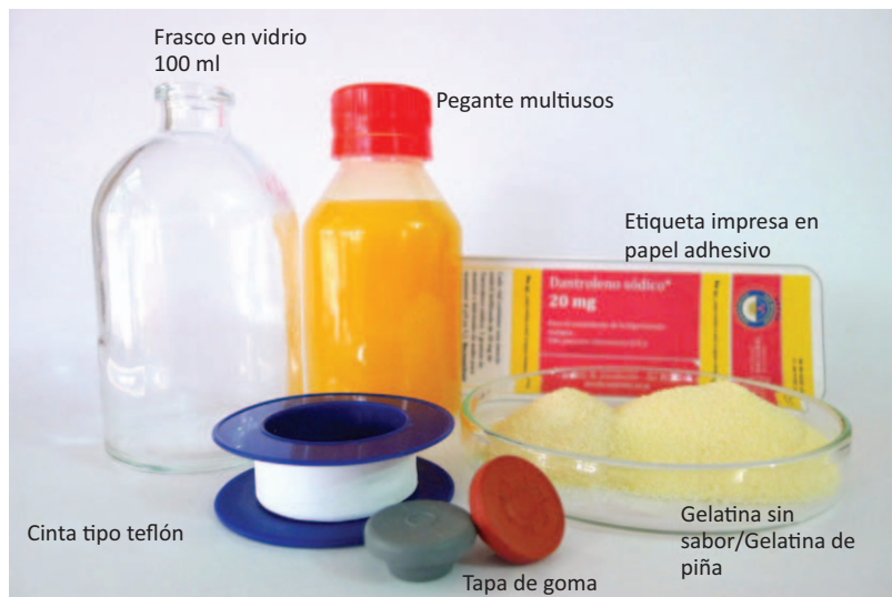
Figura 1. Materiales para la preparación del modelo.