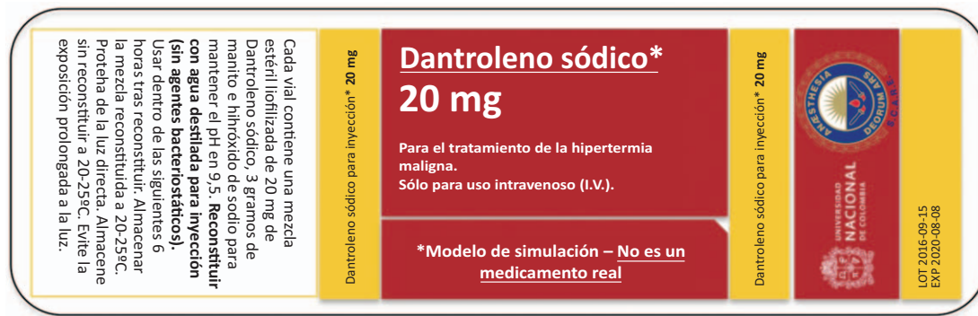
Figura 2. Etiqueta para vial de simulación. El tamaño para impresión debe ajustarse a las dimensiones del recipiente en vidrio al momento de imprimir.

dedicadas a la fabricación de artículos en vidrio; son de bajo costo y fácil obtención. La presentación del medicamento viene en viales de 70 ml, sin embargo las botellas en vidrio de 100 ml se adquieren con más facilidad.