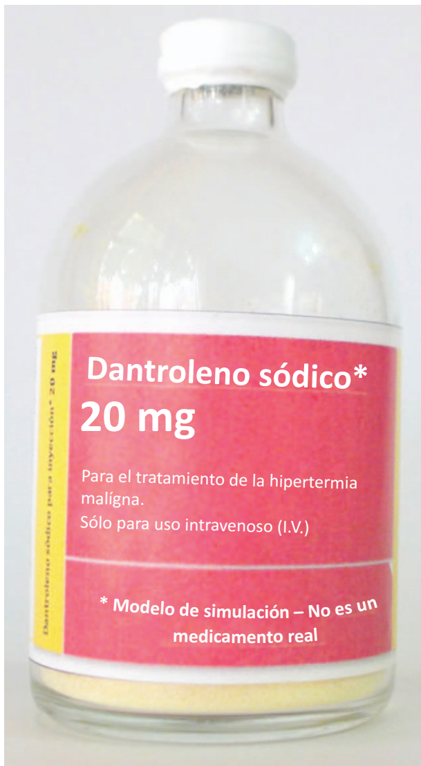
Figura 5. Modelo listo para simular la reconstitución del dantroleno.