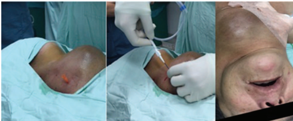
Imagens 4. Canulación percutánea de tráquea.