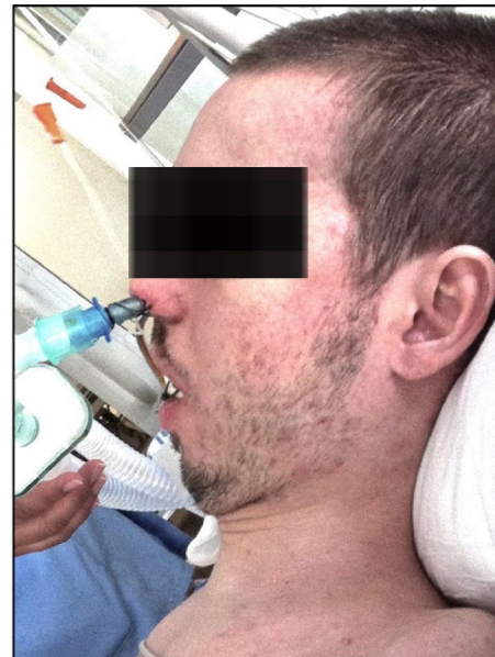
Figura 1 – Paciente con intubación nasotraqueal.

Como antecedentes, constaba que el paciente había sido intervenido a los 15 años para artrodesis D3-L4 por escoliosis paralítica. Tras la intervención, sufrió trombosis femoral profunda en miembro inferior derecho secundario a déficit de factor V de Leyden, por lo que precisó tratamiento anticoagulante oral. Debido a la restricción causada por la deformidad torácica, sufría cuadros de insuficiencia respiratoria, que evolucionaban favorablemente con fisioterapia domiciliaria, sin necesidad de VMNI. A los 20 años fue intervenido para segmentectomía apical atípica del lóbulo pulmonar superior derecho por neumotórax recidivante, sin incidencias