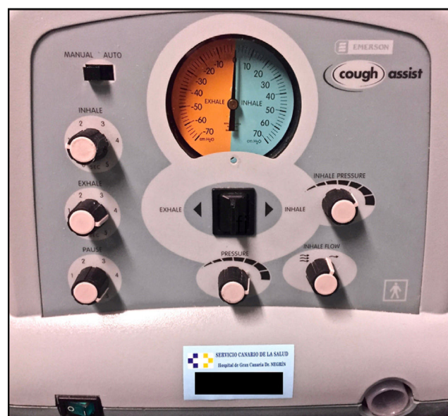
Figura 3 – Dispositivo de insuflación-exsuflación.

A los 10 días de la segunda extubación, tras comprobar mejoría en la mecánica respiratoria del paciente y en su capacidad