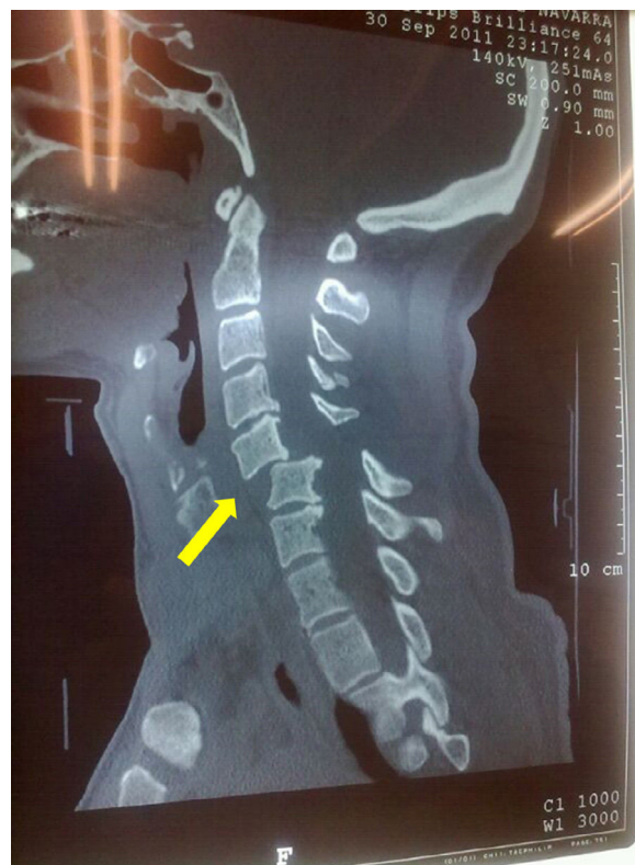
Figura 1 – Reconstrucción sagital de la TC de columna cervical de caso 1. Luxación C5-6 (flecha).