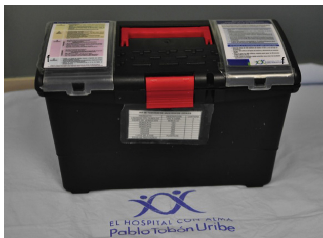
Figura 2 – Kit de toxicidad por anestésicos locales del Hospital Pablo Tobón Uribe. Nótese la facilidad de transporte, así como la inclusión de la ficha técnica (f) y el protocolo de toxicidad por anestésicos en la parte superior, para facilidad de consulta en situaciones de urgencia. Fuente: autores.

El kit (fig. 2) cuenta con emulsión lipídica al 20% (250 mL) en 4 bolsas, basados en la sugerencia de Marwick et al. 51 de disponer de una dosis total de 1.000 mL en el momento de su empleo, ante la posibilidad de recurrencia de la inestabilidad cardiovascular luego de haber logrado revertir el cuadro inicial. El kit tiene también una llave de 3 vías, 2 jeringas luer-lock de 50 mL, equipos de venoclisis y de canalización de acceso intravenoso y la ficha de protocolo. El kit tiene un costo aproximado de 400.000 pesos. Disponemos de una emulsión lipídica que contiene por cada 100 mL aceite de oliva refinado 80% y aceite de soja refinado al 20% (fig. 3). Esta emulsión debe estar protegida de la luz, almacenarse a temperaturas menores a 30 °C, no refrigerarse y agitarse antes de usar.