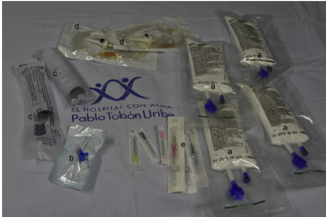
Figura 3 – Kit de toxicidad por anestésicos locales del Hospital Pablo Tobón Uribe. Detalle del contenido interior. a) Emulsión de lípidos al 20% (4 bolsas por 250 mL). b) Llave de 3 vías. c) Jeringas luer-lock de 50 mL para infusión rápida de la emulsión de lípidos. d) Equipos de venoclisis para infusión. e) Dispositivos para canalización venosa, diferentes diámetros.