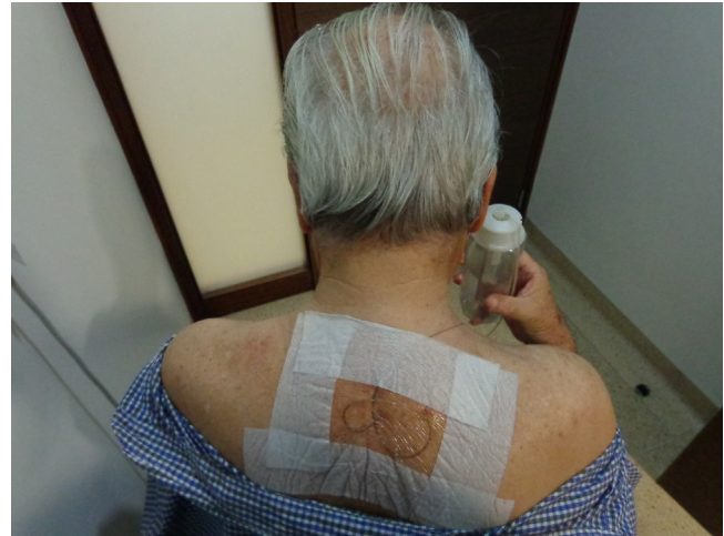
Figura 4 – Catéter epidural cervical tunelizado.