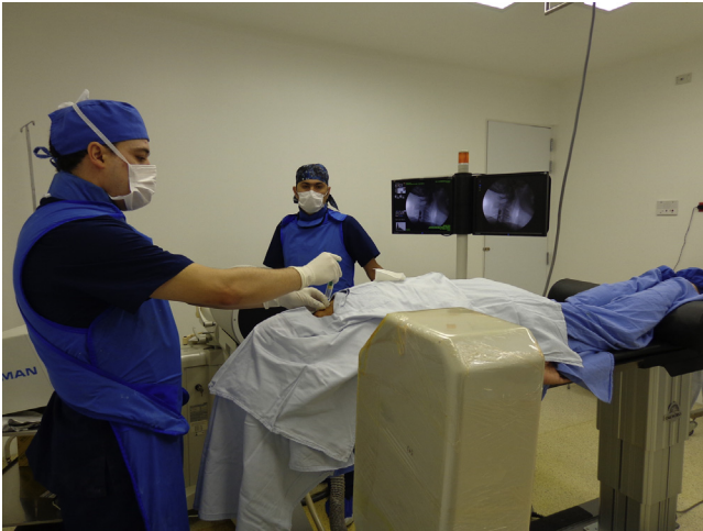
Figura 2 – Inyección epidural cervical en prono guiado por fluoroscopia.