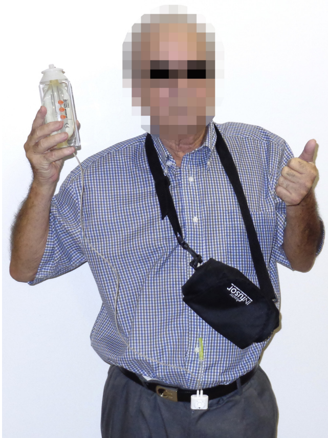
Figura 5 – Bomba elastomérica para infusión epidural cervical ambulatoria.