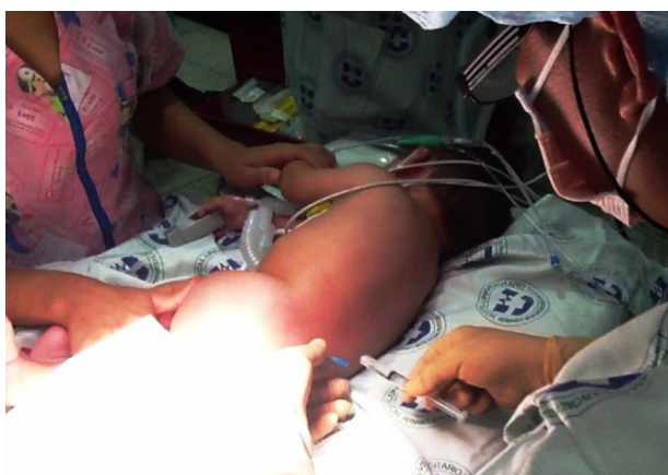
Figura 2 – Punción lumbar.