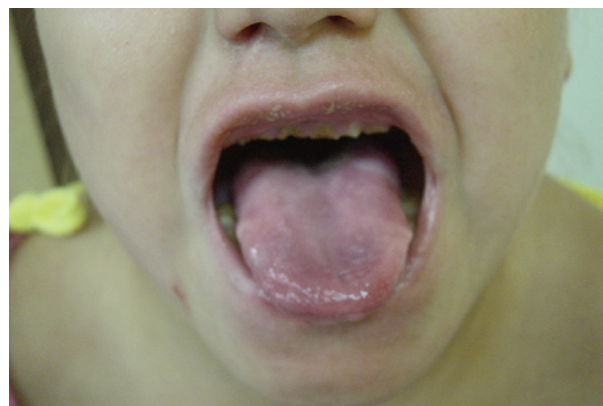
Figura 1: Excoriaciones en labios, lengua y desgaste dental severo

Figure 1: Excoriations on the lips and the tongue and severe dental wear