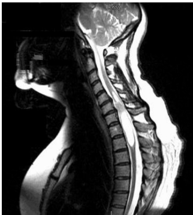
Figura 1 – Resonancia magnética nuclear cervical preoperatoria.

La paciente recibió radiación espinal cervical en el curso de los próximos 4 meses. La electromiografía/estudios de conducción nerviosa (EMG/NCS) postoperatoria reveló un estudio esencialmente normal con solo ausencia de respuesta en ambos nervios femorocutáneos laterales. Fue referida a la clínica de dolor, donde fue tratada con múltiples agentes orales y tópicos (gabapentina, pregabalina, top-