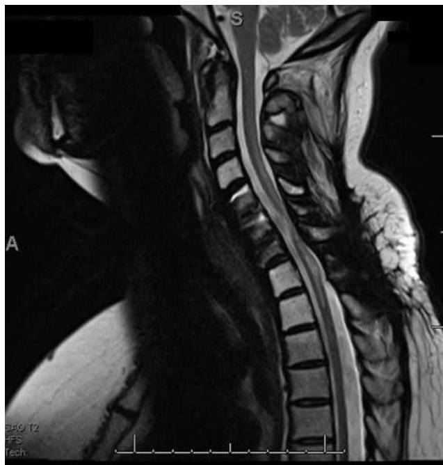
Figura 2 – Resonancia magnética nuclear cervical postoperatoria.

iramato, amitriptilina, nortriptilina, sertralina, naproxeno, tramadol, oxicodona, hidromorfona, metadona y capsaicina), experimentando efectos adversos severos, incluyendo sedación, disfunción cognitiva y desbalance. A pesar de todos los esfuerzos realizados, el dolor siguió siendo intratable. Aun cuando la estimulación medular es una alternativa controvertida para el tratamiento del dolor neuropático central 1 , basándonos en contados reportes de casos exitosos 2,3 , esta alternativa terapéutica fue considerada, ofrecida y aceptada.